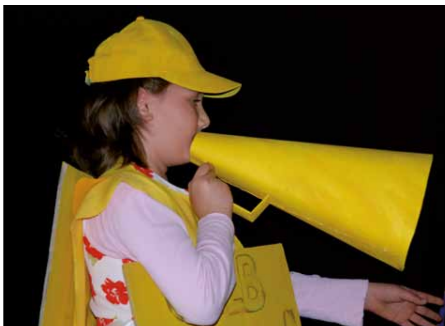
Auch so klingt der Kiez.