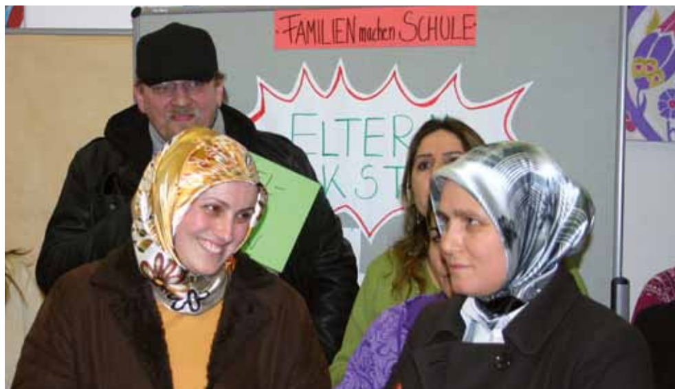
Viele Eltern nehmen das umfangreiche Angebot der Initiative „Familien machen Schule“ schon wahr. Andere müssen noch überzeugt werden.

Das Projekt soll über die Kiezgrenzen hinausgehen. Wrangel- und Reichenberger Kiez wollen