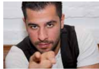
„Flug mit dem Adler“ Eralp Uzun | S. 15