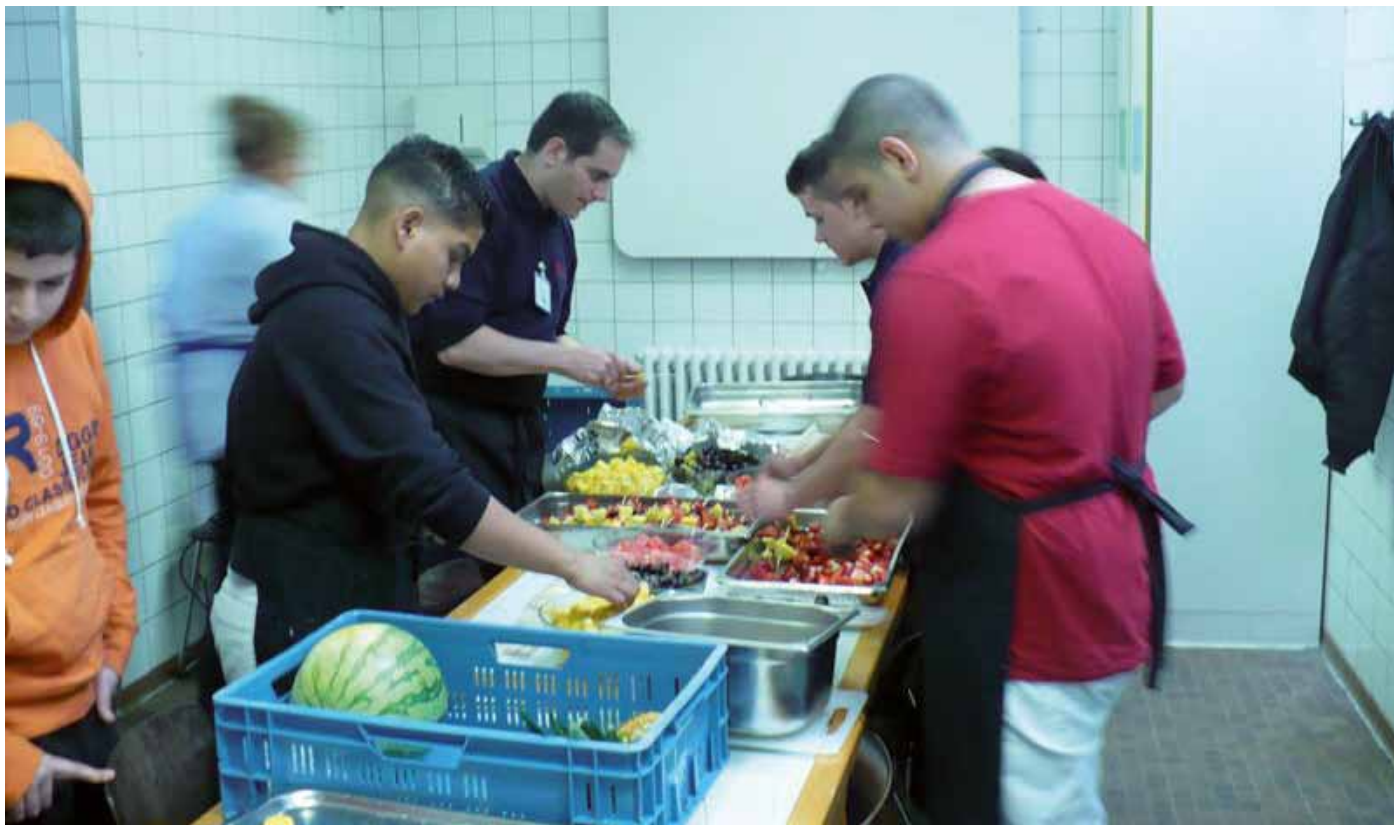
Was gehört heute auch in die Schule? Ernährungslehre und Kochen in der Cafeteria.