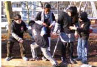
„Stopp Tokat“ mit den Wrangelkids | S. 8