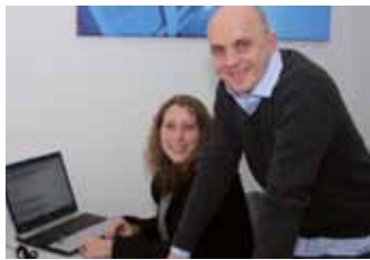
Berufsstart mit den BIK-Profis | S. 7