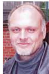
Mitautor Gerd Prill