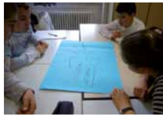
Neubeginn mit der Sekundarschule | S. 12