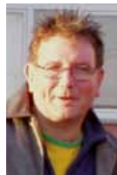
Mitautor Oliver Tempel