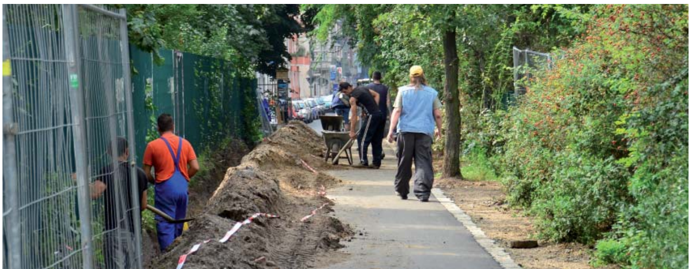
Noch gibt es genug zu tun auf und neben den Wegen im Görliitzer Park.

Parktaki çukurun orada bulunan bayırda yer alan eski tünelde, kendilerine iyi bir ortam bulan yarasalar, bu gizemli ortamı çok seviyorlar.