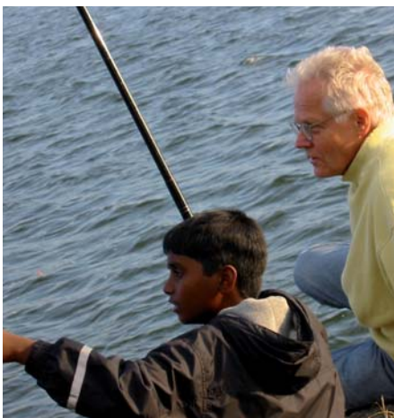
Der Pate weiß, wo die Fische stehen.