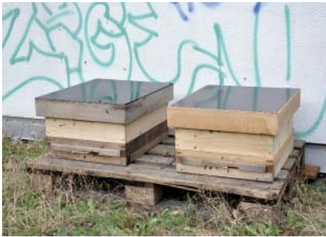
Bienenstöcke auf dem Dach.