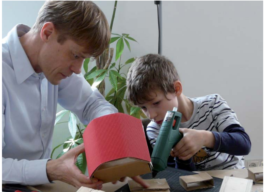
Früh übt sich, wer ein Meister werden will. Seit zehn Jahren macht biffy Patenschaftsprojekte.

Damit Kinder mehr Chancen für eine gute Entwicklung bekommen, gibt es das Patenschaftsangebot von biffy Berlin- Big Friends for Youngsters e.V. Seit zehn Jahren vermittelt der gemeinnützige Verein Erwachsene, die sich freiwillig engagieren wollen – als