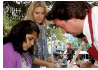
Gesund kochen für Kinder | S. 11