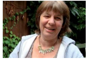
Eine Kämpferin für die Frauen | S. 15