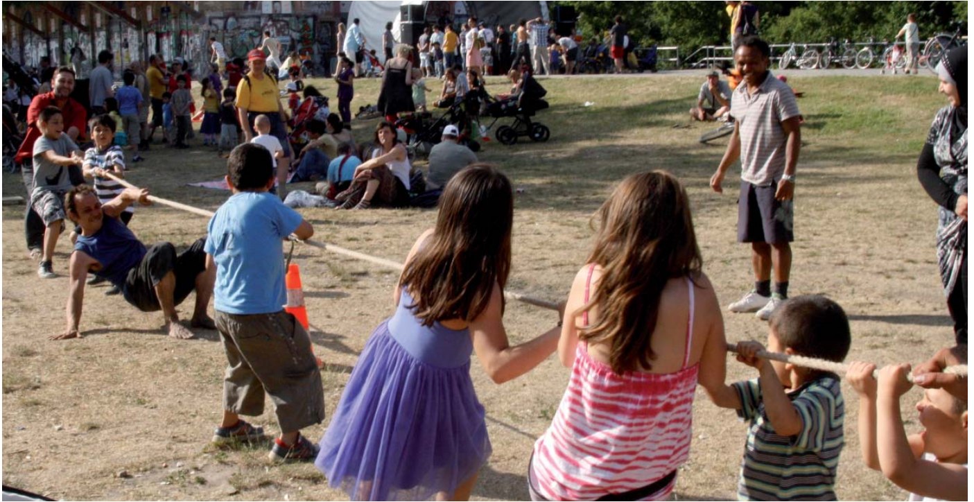
Gemeinsam an einem Strang ziehen - nicht nur beim Sport gilt dies als Erfolgsmethode.

1 Ağustos' tan itibaren Kindervelten' de bilinçli önyargılı eğitim sistemi çalışmasına, Wrangel mahallesi ve komşular da dahil oldu.