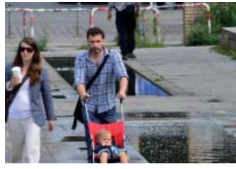
Endlich Licht für den Görlitzer Park | S. 6