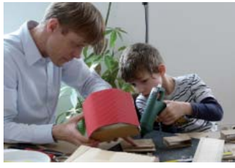
Paten für Kinder im Wrangelkiez | S. 4