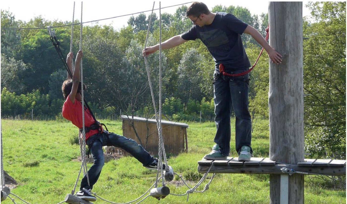
Nicht nur im Hochseilgarten ist Vertrauen gefragt.