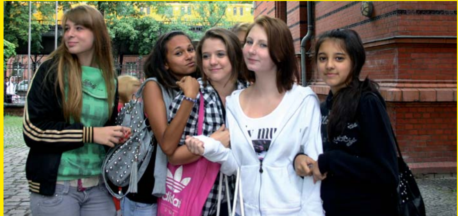
Was mögen diese Wrangelkids vorhaben? Wir wissen es nicht. Andere gaben uns Auskunft.

Auch mit der Familie will er einiges unternehmen: Shoppen oder Eis essen.