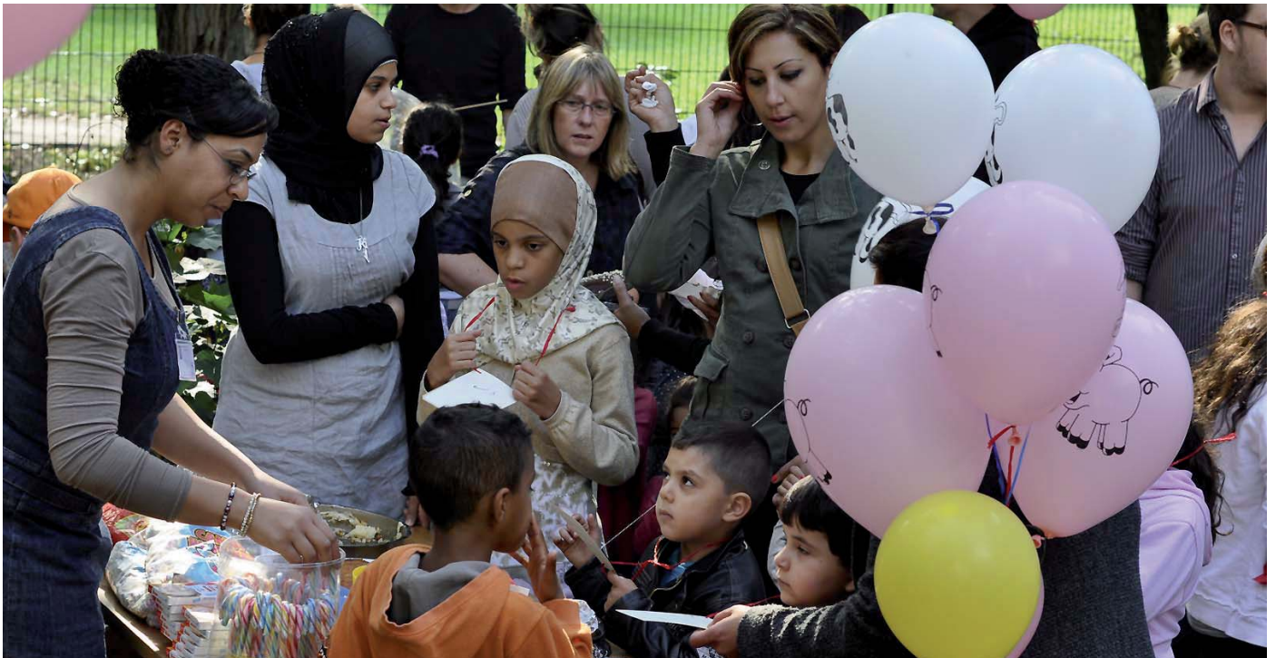
Gemeinsam feiern schafft Vertrauen.

Das so entstandene Verständnis und das Wissen umeinander schafft die Basis für ein gemeinsames Handeln für alle Kinder und Jugendlichen im Wrangelkiez.