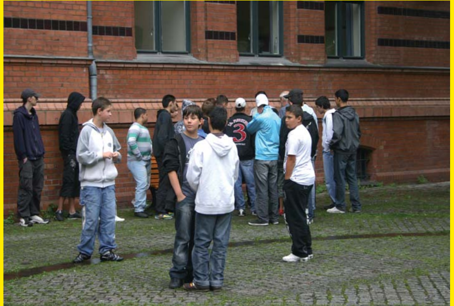
Schule aus – was nun?

die Umwelt lernen, auch ihre sozialen Kompetenzen und ihr Selbstvertrauen soll gestärkt werden. Die Ausflüge finden mit Bahn und Bus statt,